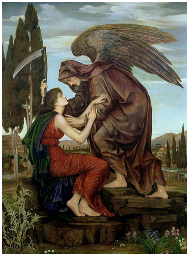
Evelyn De Morgan - The Angel of Death (1880)

I u tom trenutku pojavila se ona. Sjajna kao zvezda, sva u crnini. Pogledala me je svojim prodornim očima koje nisu imale boju, a ipak sva lepota se u njima mogla ogledati. I u tom trenu je samo nestala. Zar je sve ovo bio samo san? Ili pak nije? Pored mene gomila rasutih tableta protiv depresije, ali u meni je mir kakav već odavno nisam imala. Opet sam imala svu onu snagu da promenim svet. Iskra života